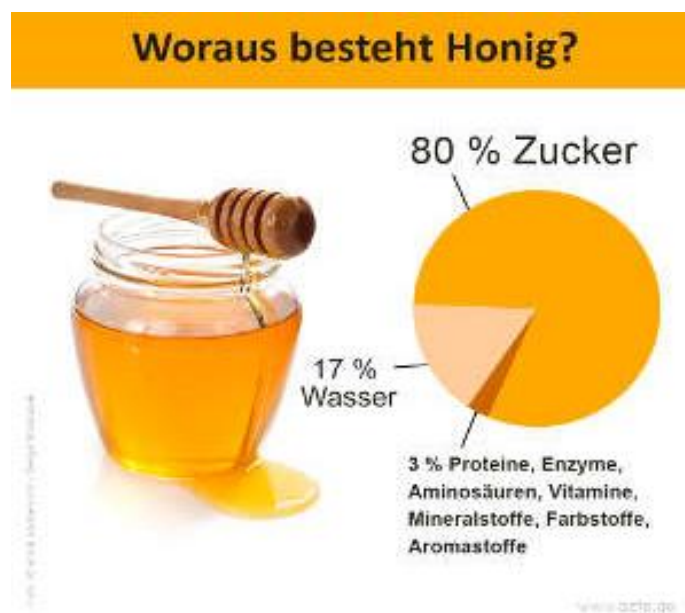
Abbildung 4: Woraus besteht Honig (Menn, 2019)

Auch Booth (2004) beschreibt, dass Zuckerpasten eine kontrollierte Freisetzung des antiseptischen Wasserstoffperoxids in einer für das Gewebe ungiftigen Menge ermöglichen.