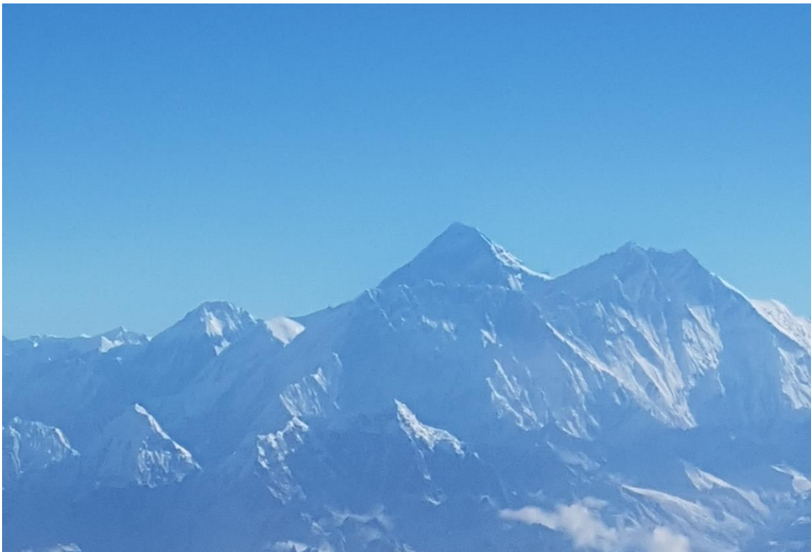
Abbildung 1: Mount Everest