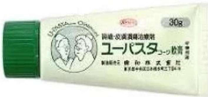
Abbildung 3: U-PASTA KOWA Ointment 30g, Japanische Povidon-Jod-Zuckersalbe (D.Pharmacy Kitaoka, 2023)

Schlussfolgerung nach Hihara et al (2022), Kohlendioxid-Fußbäder können die Durchblutung der Haut bei Patienten mit ischämischen Geschwüren verbessern, jedoch gibt es keine klinischen Studien über die Dynamik des Knochenstoffwechsels.